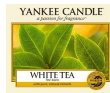
WHITE TEA ホワイトティー

マリンノートからフローラル、アンバーへの移ろいは、丘の上に輝く花々を眺めながら海岸沿いを散策する気分。